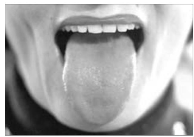
EIN HORT FÜR BAKTERIEN: Zungenbelag kann bei vielen Menschen zu Mundgeruch führen.